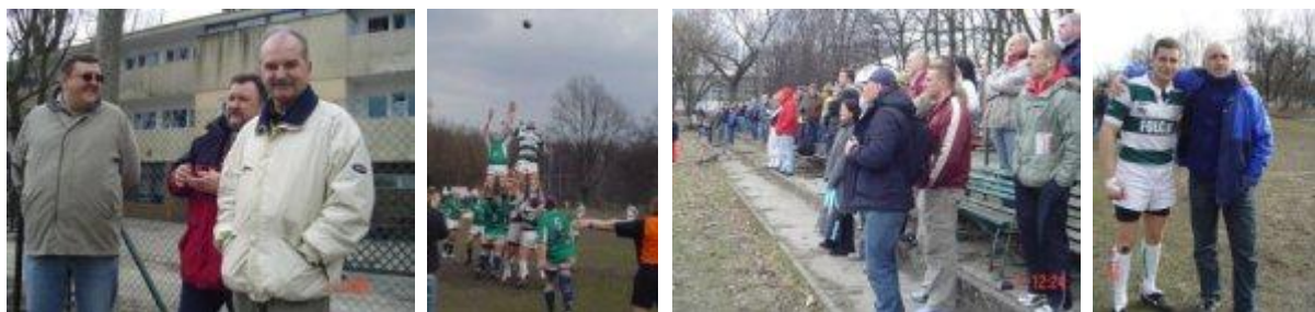
Inauguracja wiosennych rozgrywek w Warszawie /zdjęcia: PZR/:

Nie była to szczęśliwa sobota dla trójmiejskich zespołów. O ile jednak przegraną Lechii na boisku lidera trudno uznać za niespodziankę, to przegrana gdyńskiej Arki - obrońcy tytułu i zdobywcy Pucharu Europy - w Krakowie jest prawdziwą sensacją. W Warszawie, Folc AZS zaprezentował kilka efektownych akcji w ataku i zasłużenie wygrał z Lechią 29-12 (12:5), a Juwenia wygrała 30-27 (11:8) sprawiając swym sympatykom olbrzymią frajdę już na początku rundy rewanżowej. W trzecim dzisiejszym meczu Pogoń, pomimo prowadzenia 3:0 po 30 minutach gry, wyraźnie przegrała z faworyzowaną ekipą Budowlanych Łódź 3-36 (3:14).